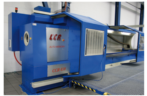
Schenker CNC 2015

Für nahezu alle Bereiche in der Mobil- und Stationärhydraulik wie: Papier- und Textilindustrie, Kraftwerke, Bauwirtschaft, Fördertechnik, um nur einige zu nennen.